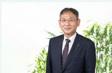
CFO メッセージ 15

“More Smiles!” グループパーパスの 実現に向けて、浸透から実践のステージへ 13