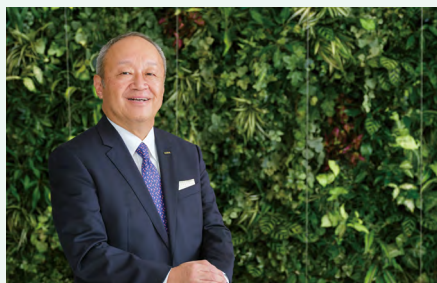
CEO メッセージ 07