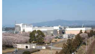
フジタック生産子会社 富士フィルム九州(株)