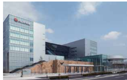
富士フィルム先進研究所 (4月オープン)