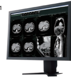
医用画像情報システム (PACS) [SYNAPSE]

トータルヘルスケアカンパニーとして「予防」「診断」「治療」の領域で幅広い事業を展開